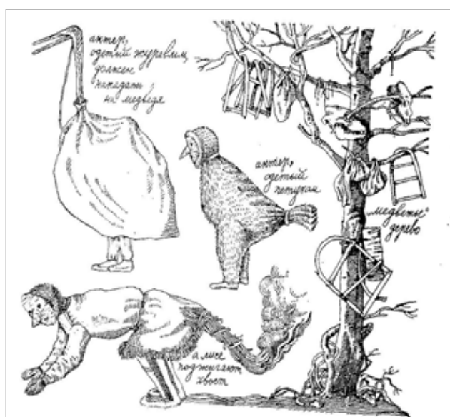
Рис. 3. Персонажи Медвежьего праздника

Структура праздника, длящегося 3–5 дней, включает песни и драматические представления, перемежающиеся танцами. Стерх является одним из главных и обязательных персонажей действия. Он агрессивно ведет себя по отношению к самому медведю, повествуя в песенной форме, что тот разорил стершиное гнездо. Актер, одетый в журавлиный костюм, щелкает клювом, клюет медведя, пытается сорвать поднесенные тому украшения. Здесь, в противостоянии стерха – в качестве предка фратрии Мось, и предка фратрии Пор – медведя, мы видим воплощенное следствие дуально-фратриальной организации