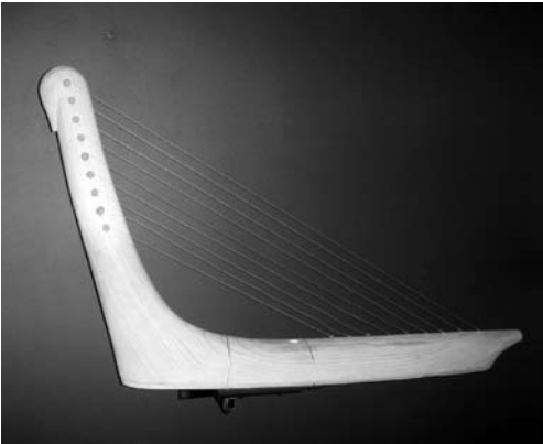
Рис. 2. Арфа-торын (экспонат музея «Природа и человек» г. Ханты-Мансийск)