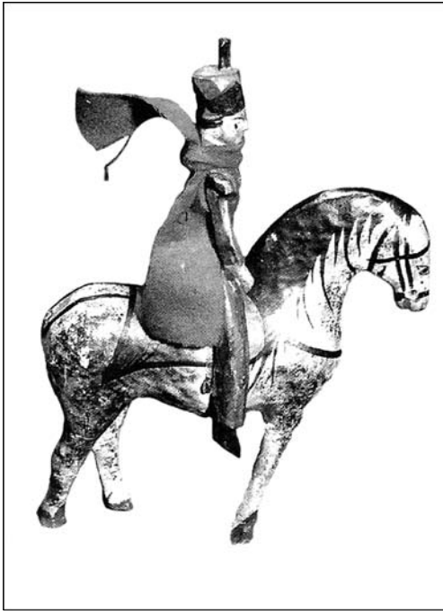
Рис. 1. Фигура всадника – изображение Мир-сусне-хума