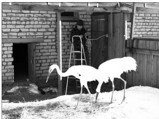
Рис. 2. Установка камеры видео наблюдения в вольере пары № 3